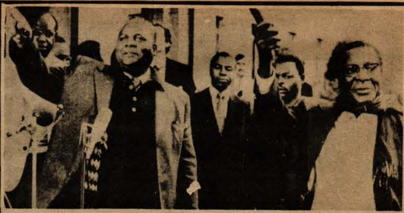
Zimbabve halkının devrimci mücadelesine önderlik eden Yurtsever Cephe'nin iki lideri Nkomo (solda) ve Mugabe