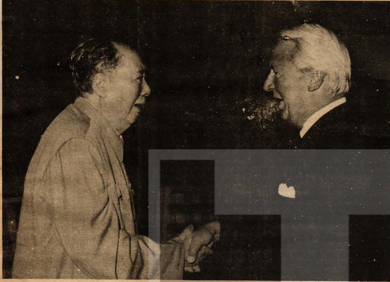
BAŞKAN MAO, İKİNCİ DÜNYA ÜLKESİ İNGİLTERE'NİN ESKİ BAŞBAKANLARINDAN EDWARD HEATH İLE

ramalar yapmaksızın, düz ve yeknesak olarak geliştiğini zannetmek, "diyalektikçe, bilime aykırı olup, teorik bakımdan da doğru değildir" (aynı eser).