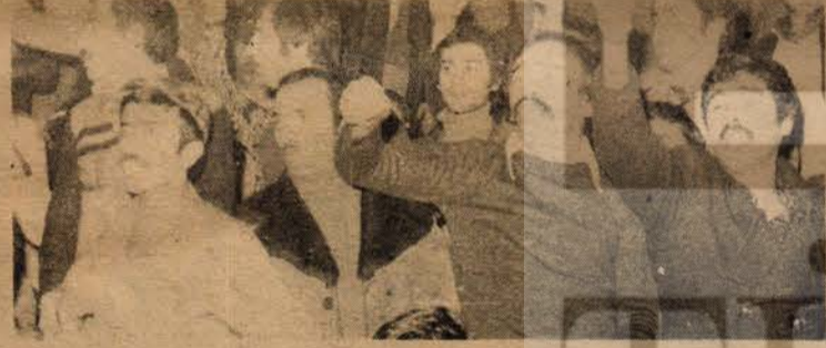
Her "vatanım" sözü geçtiğinde, "Yaşasın Sovyetler Birliği" diye bağırın İGD'liler

DiSK'in kuruluş yıldönümü gecesi, bütünüyle revizyonizmin işçi düşmanı yüzünün bir kere daha görüldüğü bir gece oldu.